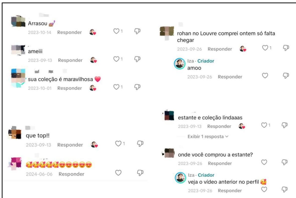
Figura 2 – Seção de comentários da booktok Izabele Peixoto (2023)