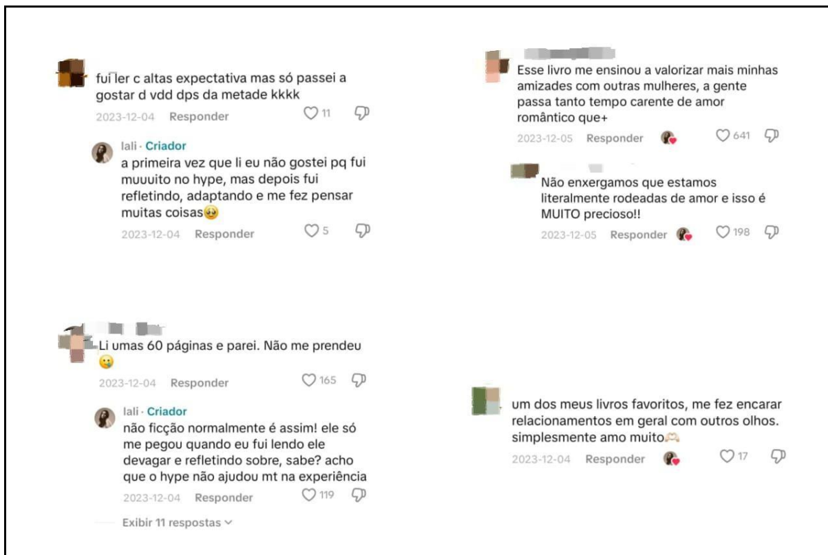
Figura 3 – Seção de comentários da booktoker Alice Farias (2023)